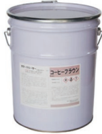
カラーリリーサー (全4色)