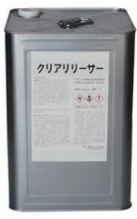
クリアリリーサー