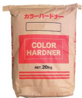
カラーハードナー (全9色)