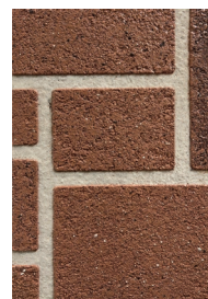
④ アシュラータイル ストーンピンク