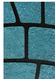
⑨ ヨーロピアンファン ブルー

注1) キャンペーン対象は本キャンペーン用紙をFAXいただいた認定施工店様のみとさせていただきます。