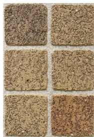
③ ピンココ(網) ストーンイエロー