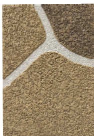
① ブッシュロック ストーンイエロー