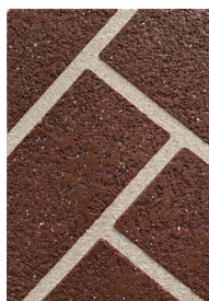
⑥ ヘリンボン テラコッタ