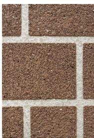
② アシュラータイル ベージュ