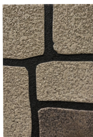
⑦ カットストーン ストーングレー