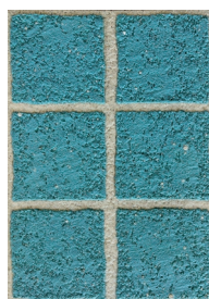
⑤ ピンココ(網) ブルー